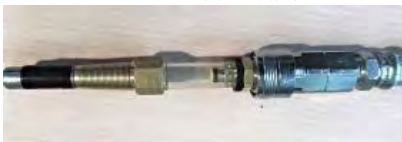
ワンタッチソケット用に改良

ケミカルポンプを多用することで、コンクリート表層部分の亀裂や内部空隙の充填に威力を発揮する。またポンプを複数使用することで、充填した内部で科学的反応により、一体化した補修と強度の期待ができる。