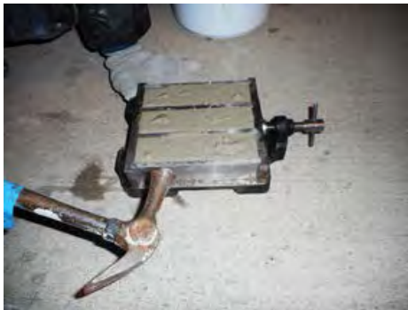
SKY-CSP60% (W/C) のペースト 供試体採取時