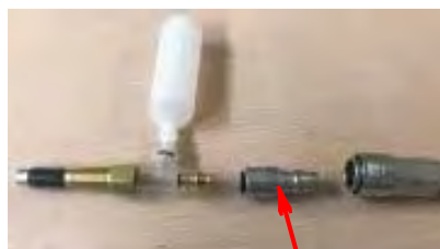
ワンタッチ接続アタッチメント